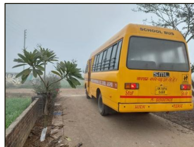
Dette er den nye skolebus, som bare mangler at få skolens logo malet på.