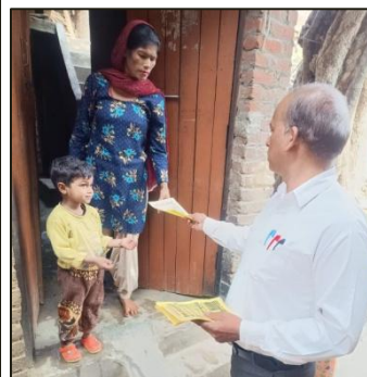
Særlig 3 af lærerne, de mandlige, gør en stor indsats for at få kontakt til "nye skoleforældre" mange har arbejde som mædes.